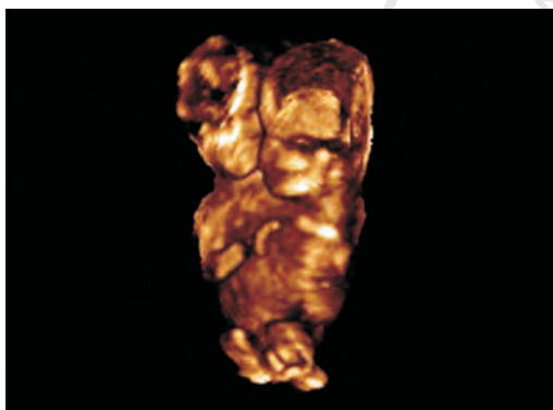
Slika 2 Dicephalus 3D prikaz u 14. nedjelji