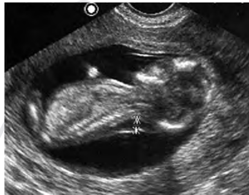
Slika 6 2D prikaz embrija sa nuchalnom translucencom

Langdon Down je još 1866. godine uočio zajedničke fenotipske karakteristike kod osoba sa trisomijom 21. para: nedostatak elasticiteta kože koji daje utisak viška kože na tijelu i pljosnato lice sa malim nosom. Nagli razvoj i digitalizacija ultrazvučne tehnike devedesetih godina prošlog vijeka omogućio je vizualizaciju tog »viška kože« na vratu ploda krajem trećeg mjeseca trudnoće. To zadebljanje vrata, označeno je kao nuchalna translucenca (NT) ili dorzonuchalni edem (DNE), pokazalo je visoku stopu korelacije sa hromozomskim aberacijama (Slika 6, 7).