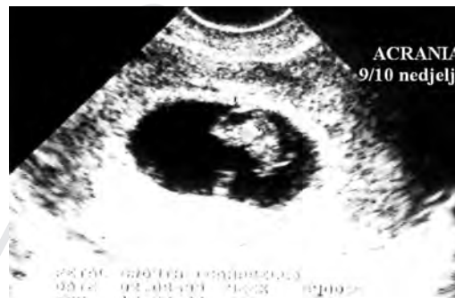
Slika 3 Anencefalus -2D prikaz u 10. nedjelji

Koštane strukture glave ploda vidljive su već od 10. a intrakranijalne od 14. nedjelje trudnoće. Vaginalnim pregledom na početku II trimestra moguće je vidjeti slijedeće anomalije: anencefalus, akranija (Slika 3), ventrikulomegalija, hidrocefalus, mikrocefalija, anomalije stražnje lobanjske jame, aplazija i hipoplazija malog mozga, holoprocencefalija, ciste pleksusa horioideusa, spina bifida, meningocele i meningomijelocela (Slika 2).