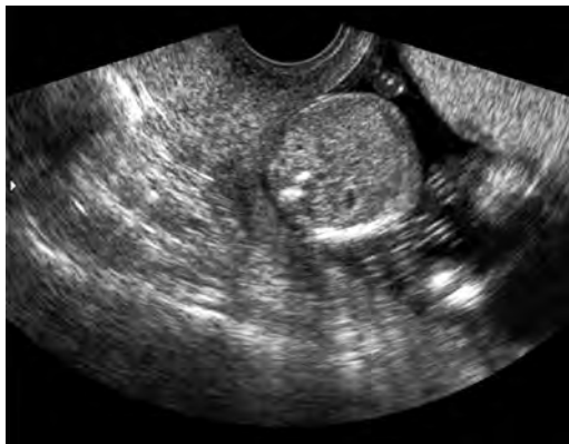
Slika 10 2D prikaz pijelektazije