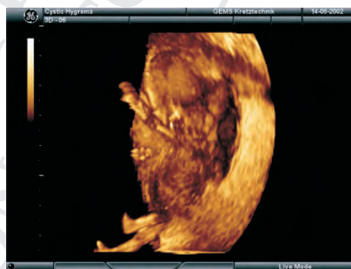
Slika 7 3D prikaz embrija sa cističnim higromom